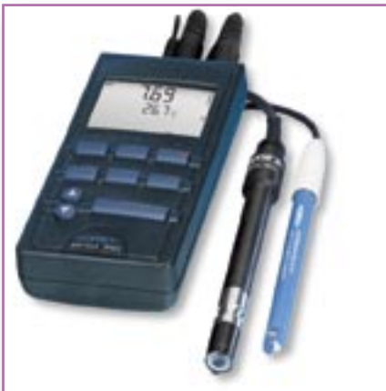
Multi 340i; pH/Oxi 340i, pH/Cond 340i