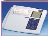
Terminal Level 3