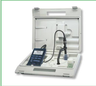
Jedes Taschen-Konduktometer ist in einer kompletten SET-Ausstattung erhältlich.