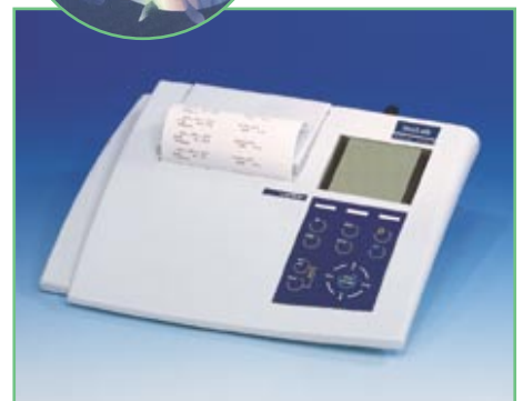
Terminal Level 3